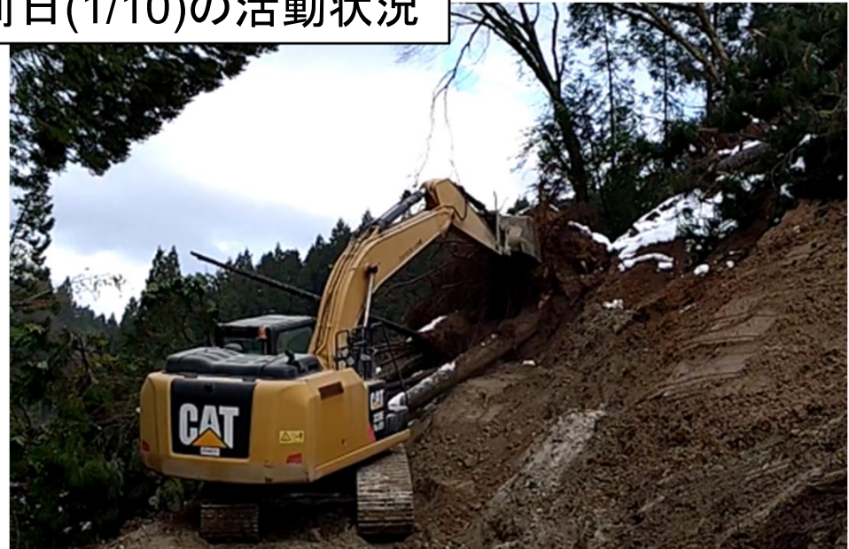
R249輪島市門前町浦上付近 倒木除去作業