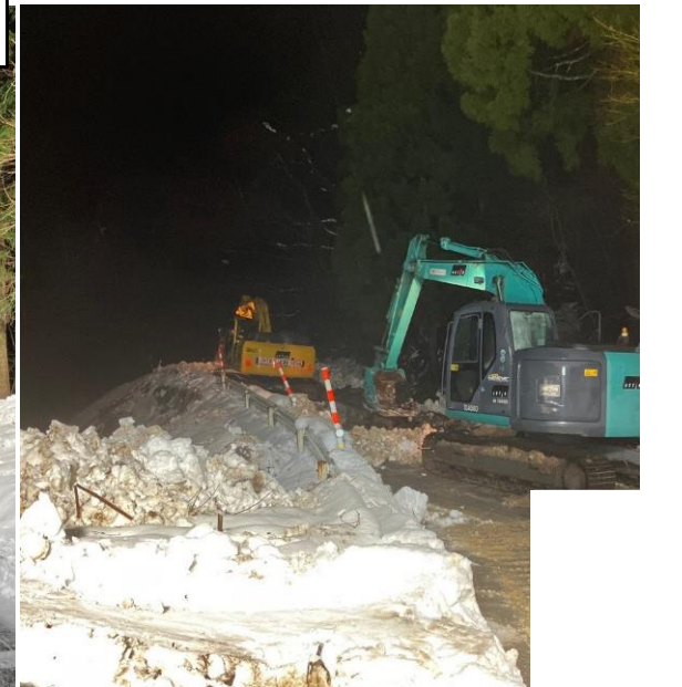
(主) 珠洲里線 八太郎峠付近(珠洲市側) 除雪作業