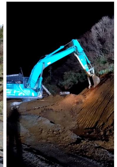
R249輪島市稲船町付近 大型土嚢設置・崩落土砂撤去作業