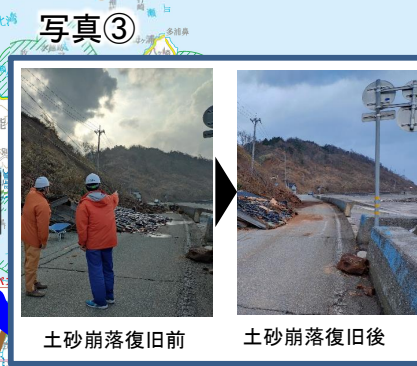
国道249号緊急復旧完了