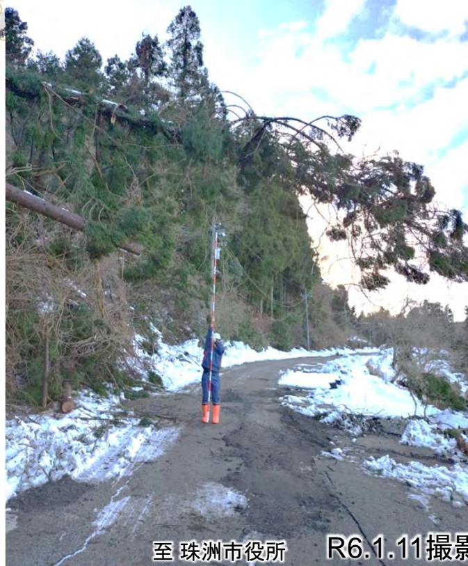
至 珠洲市役所 R6.1.11撮影