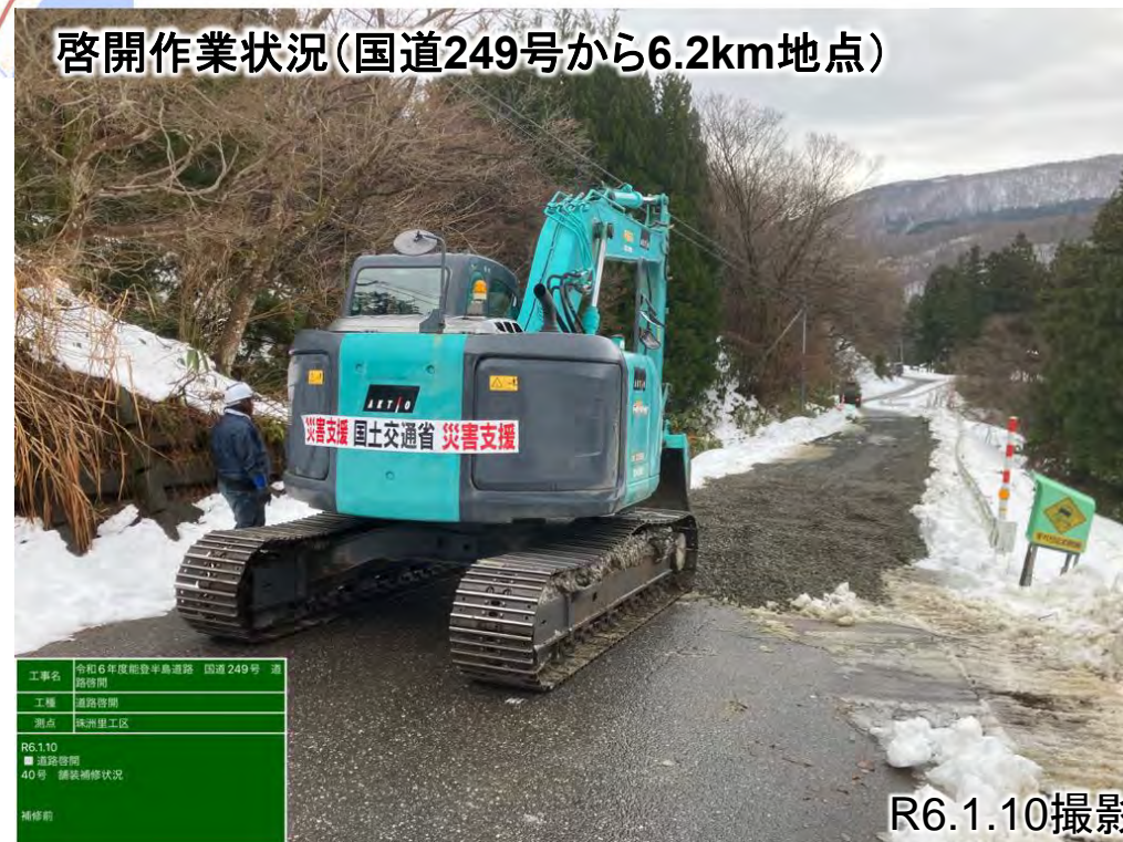
啓開作業状況(国道249号から6.2km地点)