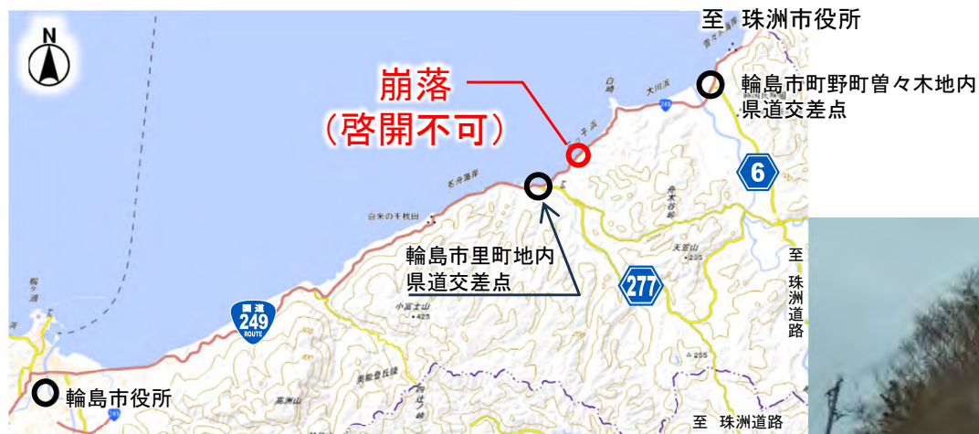
崩落箇所の被災状況