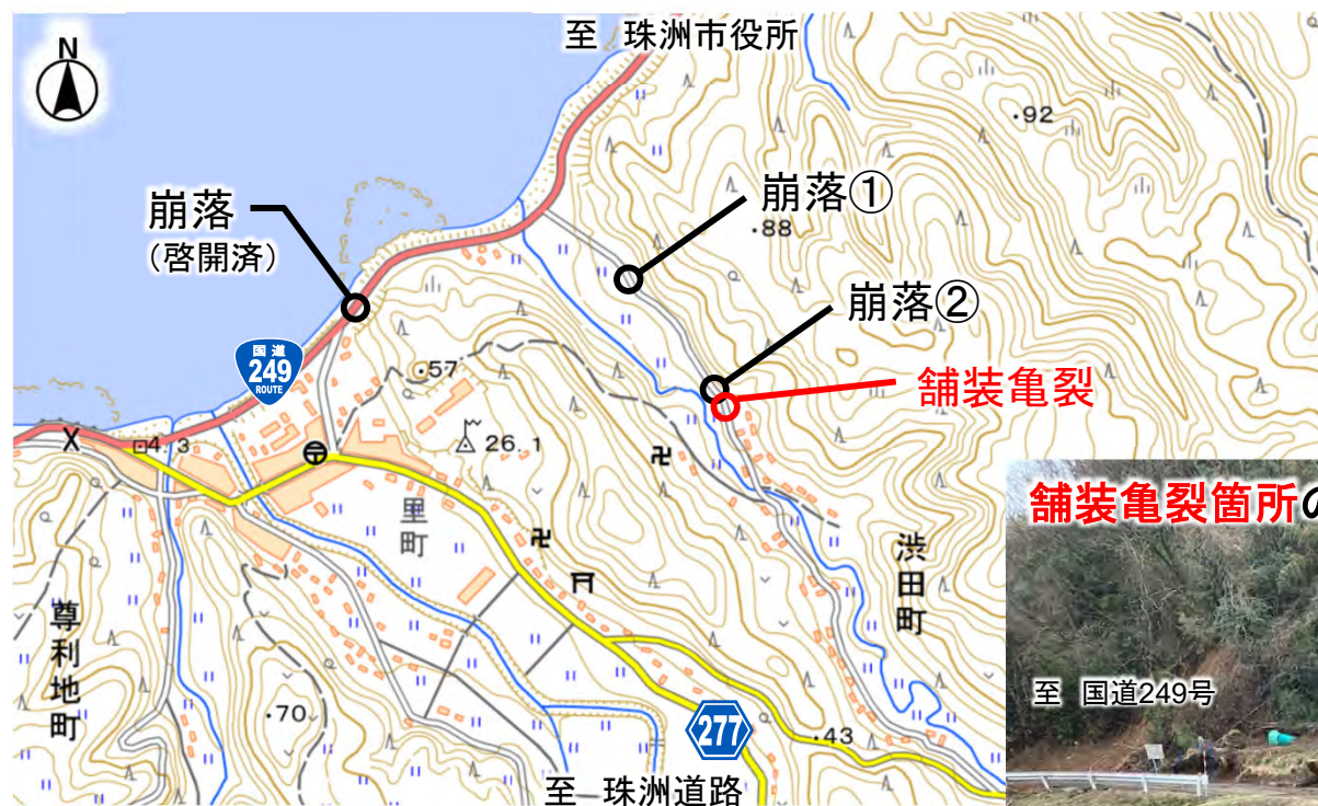
舗装亀裂箇所の啓開作業状況