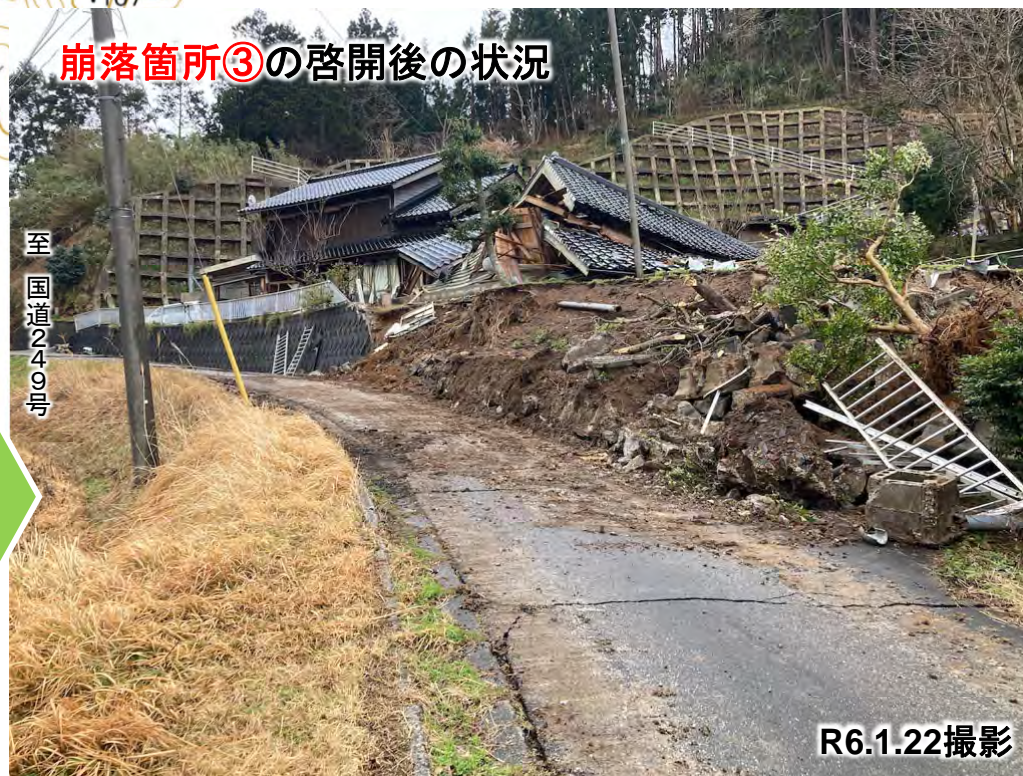
崩落箇所③の啓開後の状況