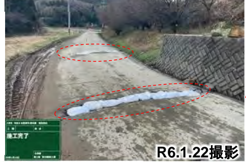
舗装損傷箇所を啓開状況