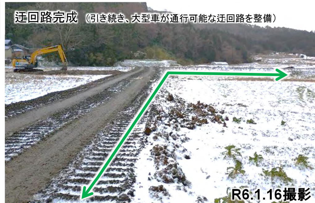
迂回路完成 (引き続き、大型車が通行可能な迂回路を整備)