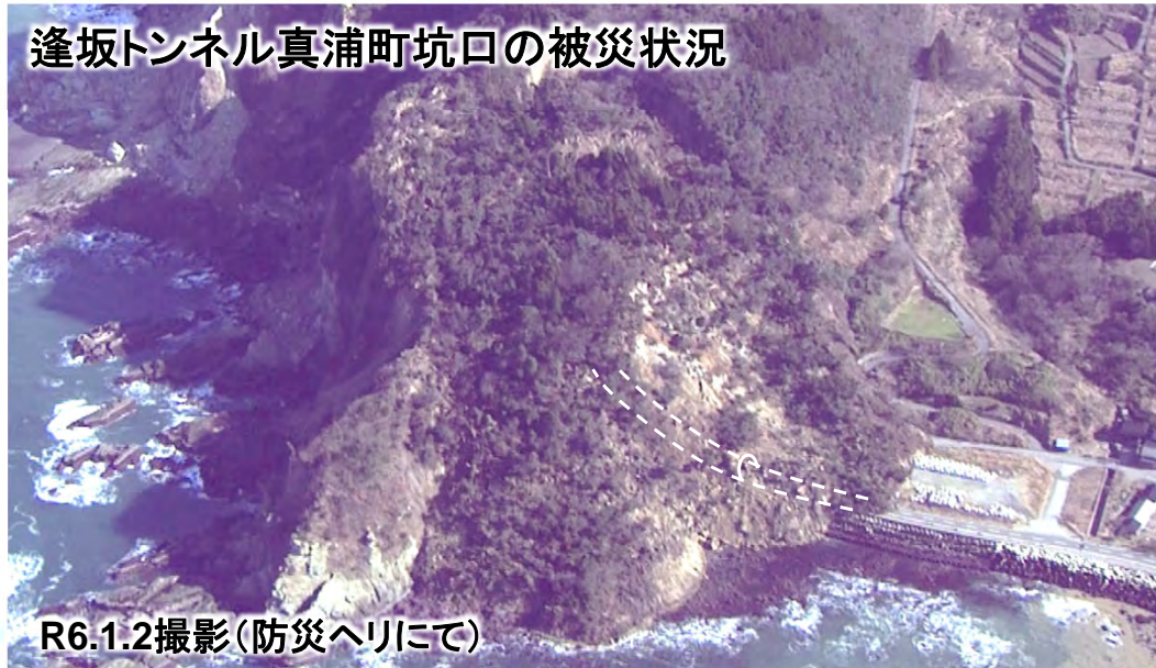
逢坂トンネル真浦町坑口の被災状況