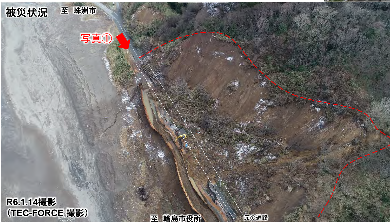
地震前から片側交互通行規制を実施し、道路工事を行っていた現場