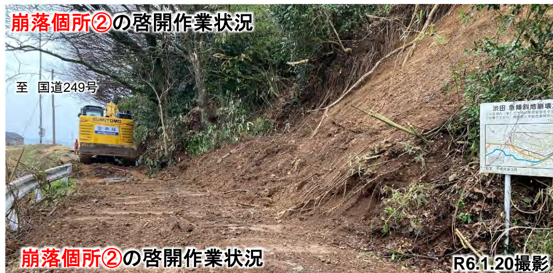
崩落箇所②の啓開作業状況