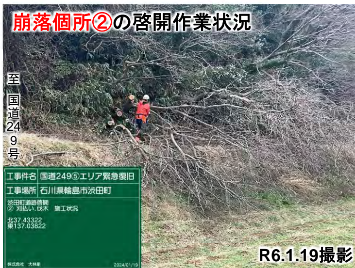
崩落箇所②の啓開作業状況