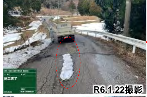
舗装損傷箇所を啓開状況