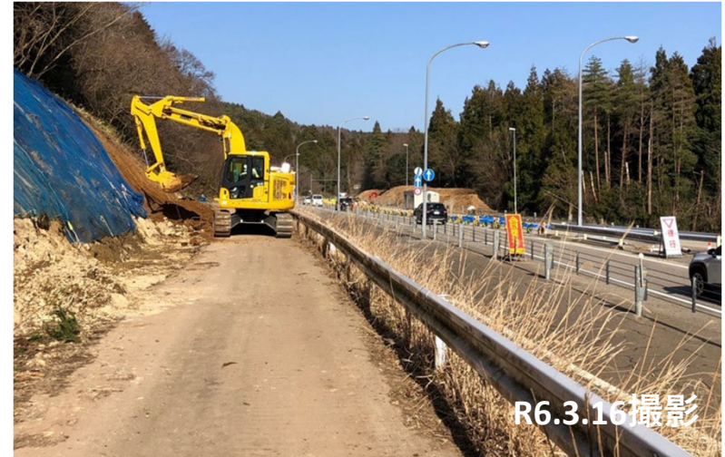
No.1付近 伐採作業状況