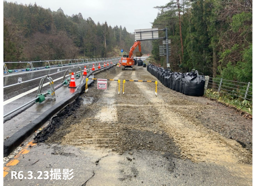
No.4付近 路盤整地状況