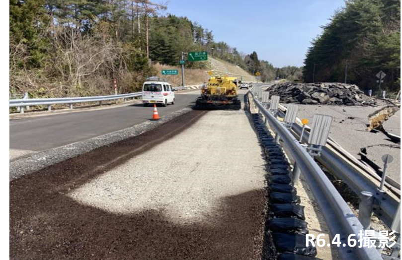
No.38付近 アスファルト舗装 乳剤散布状況