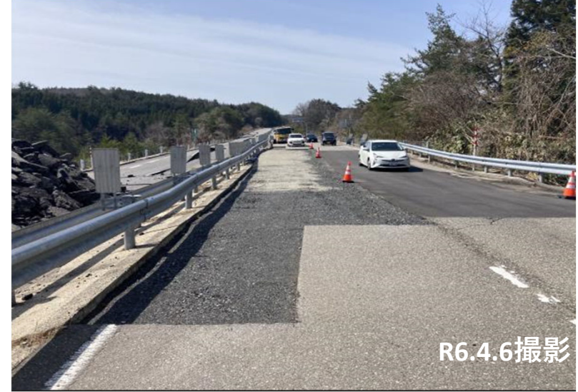
No.37付近 路盤完了状況