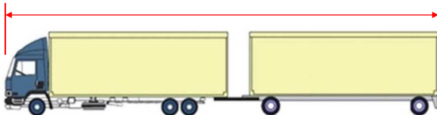
フルトレーラ連結車（バン型）25mまで