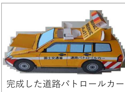
完成した道路パトロールカー