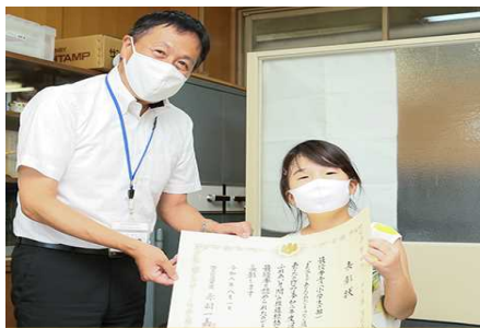
西宮市立瓦林小学校校長室にて