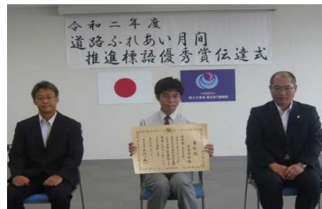
東北地方整備局仙台河川国道事務所にて