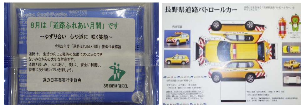
道路愛護標語入り ウエットティッシュ