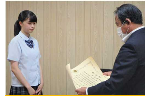
宮崎第一高等学校校長室にて