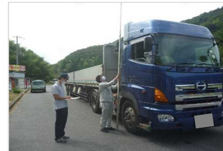
兵庫県における指導・取締りの様子 (新温泉土木事務所)