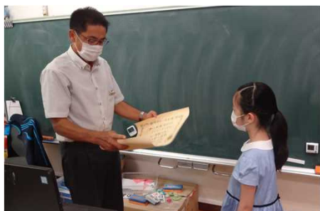
千代田区立番町小学校教室にて