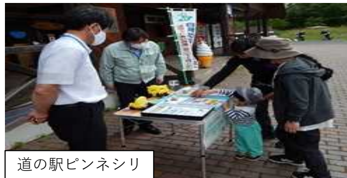
道の駅ピンネシリ