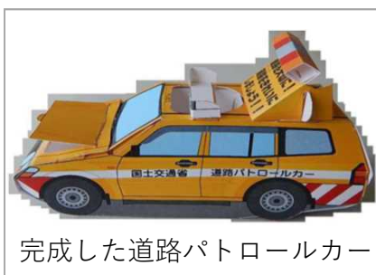
完成した道路パトロールカー