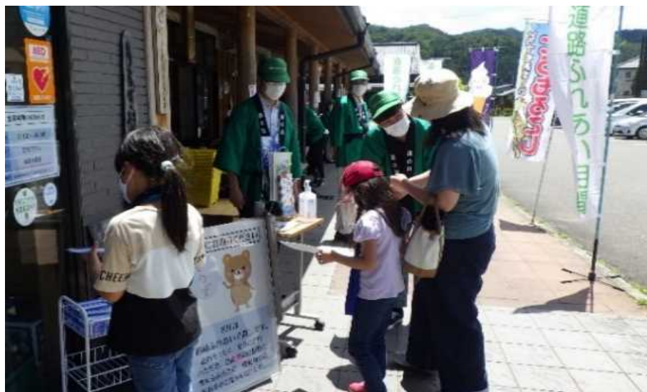
道の駅「南信州うるぎ」