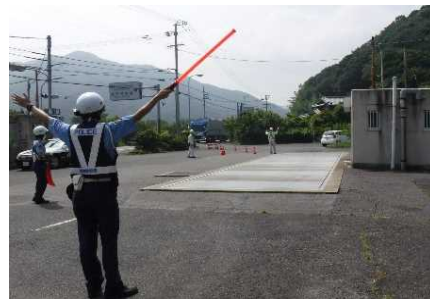
四国地方整備局における指導・取締りの様子 (徳島河川国道事務所)

道路構造物の劣化を加速させる主要因となる特殊車両・過積載車両の通行に対する指導・取締りを通じて、道路利用の法令遵守の意識向上を促し、道路構造の保全や道路交通の危険防止につながる取組を行いました。