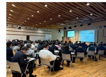
日本風景街道大学の様子