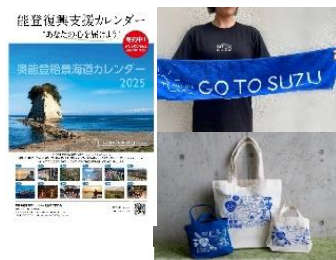
日本風景街道「奥能登絶景海道」オリジナルグッズの企画・販売