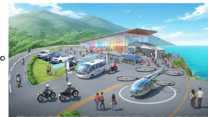
「能登半島絶景海道の創造的復興に向けた基本方針」 「道の駅」の集客強化のイメージパース