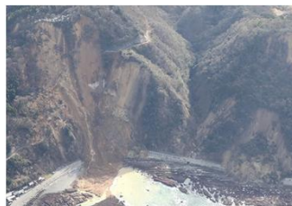
令和6年 能登半島地震