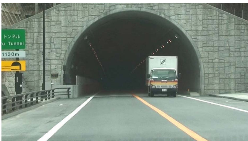
▲ 開通後の仙人峠道路（トンネル部）