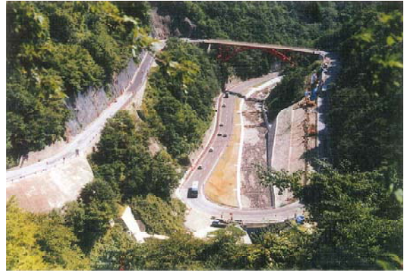
▲ 仙人峠道路開通前の国道283号