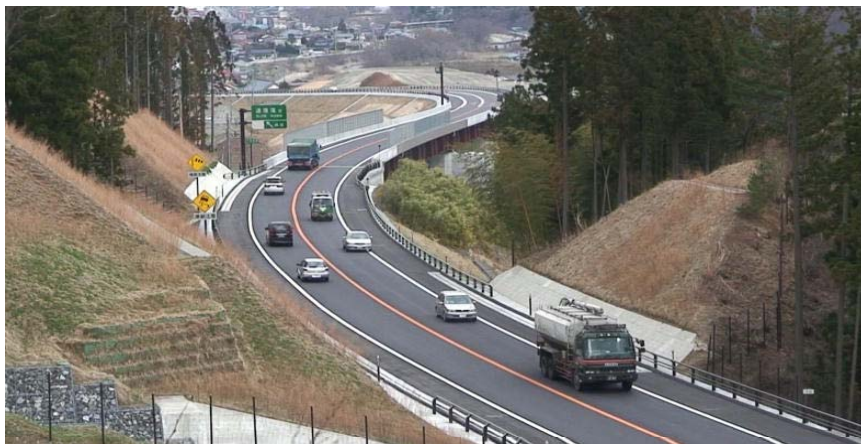
▲ 開通後の仙人峠道路（一般部）