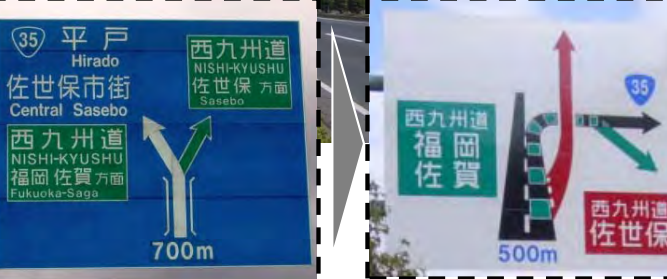
道路構造がイメージできる案内標識の設置