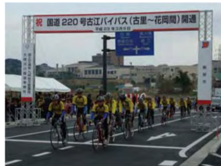
古江バイパス(古里～花岡間) 平成23年3月6日開通式典