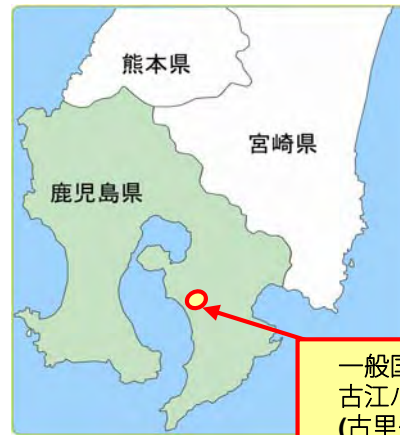
一般国道220号 古江バイパス (古里～花岡間)