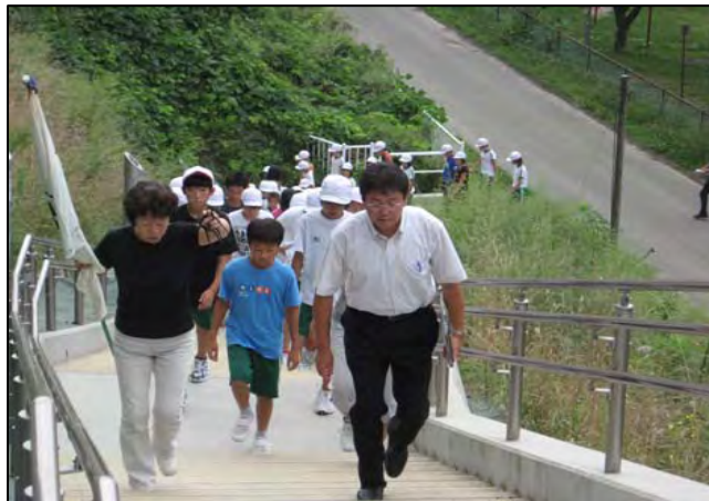
新たに設置された避難階段 (避難訓練時の状況)