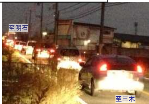
平成24年11月8日 (17時台) 撮影