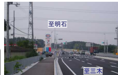
平成25年9月13日 (7時台) 撮影