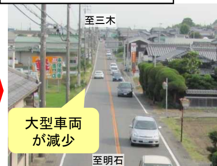
平成25年6月5日 (8時台) 撮影