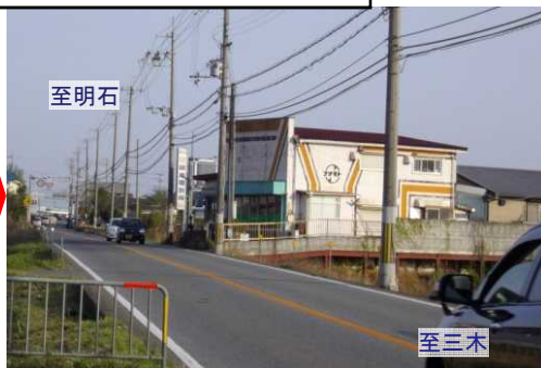
平成25年4月17日 (17時台) 撮影