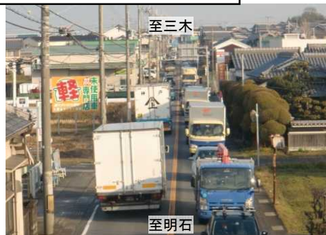
平成25年2月13日 (8時台) 撮影