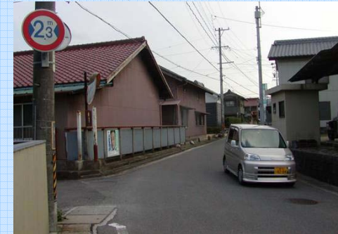
狭隘な住宅地を通過