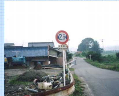
狭隘・大型車通行不可の表記