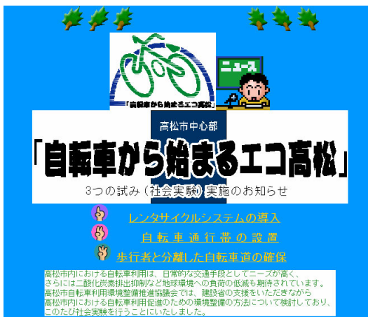
ホームページ（トップ）