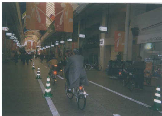
白線上にカラーコーンを設置した自転車通行帯