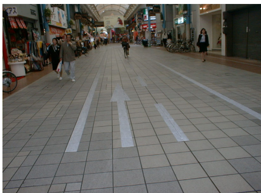
白線による自転車通行帯