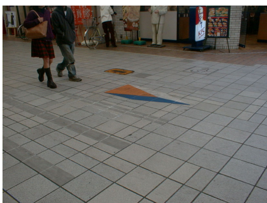
自転車利用者に注意を促すための速度抑制シート