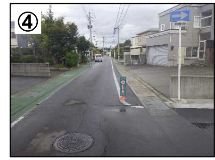
狭さく(ラバーポール)