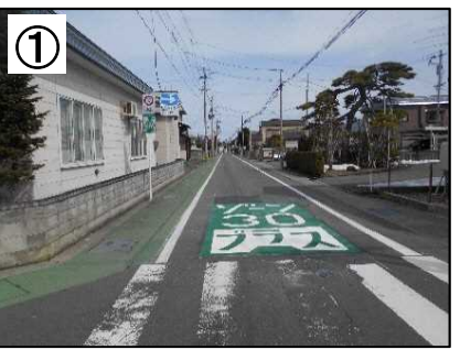
ゾーン30プラス路面表示