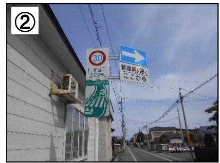
ゾーン30プラス看板