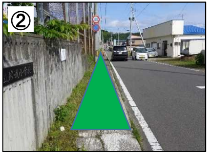
② 歩道のカラー舗装【予定(イメージ)】