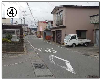
④ ゾーン30プラス看板・路面表示【予定】