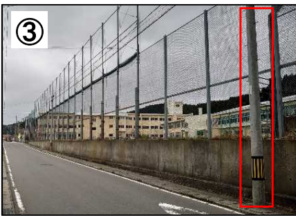
③ 電柱移設(沿線4本)【予定】