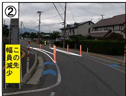
狭さく【予定(イメージ)】