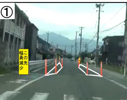
狭さく【予定(イメージ)】