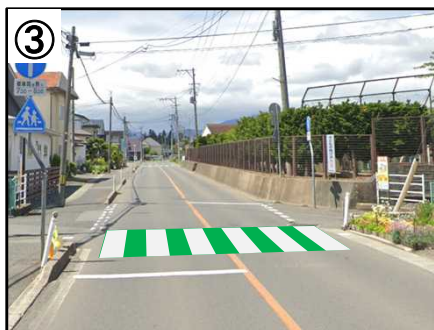
横断歩道カラー舗装【予定(イメージ)】