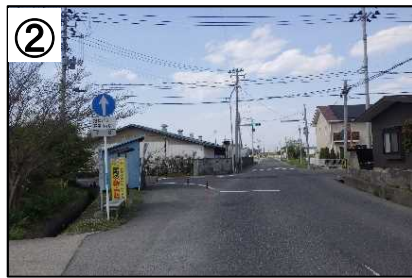
指定方向外進行禁止