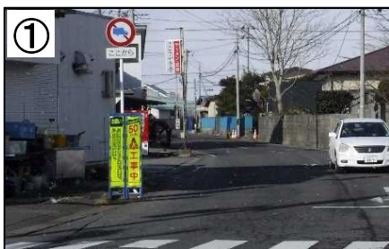
大型自動車等通行止め