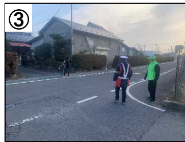
登下校時の見守り活動