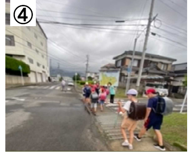
登校時の見守り活動