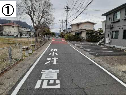
狭さく・路面表示