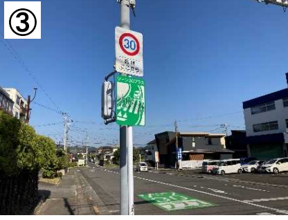
ゾーン30プラス看板・路面表示