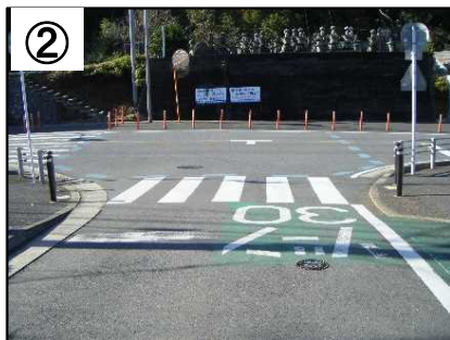
ゾーン30プラス看板・路面表示(予定)