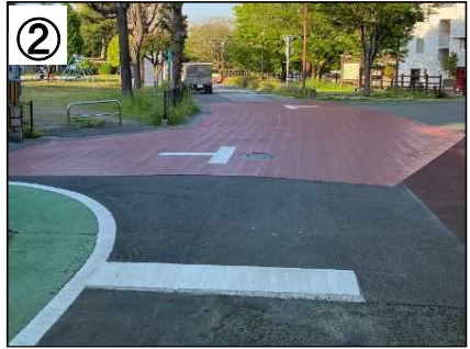
交差点カラー舗装