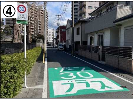
ゾーン30プラス看板・路面表示