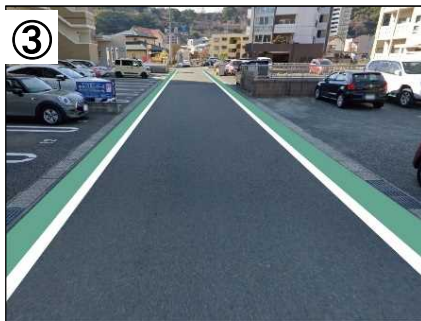
カラー舗装整備イメージ