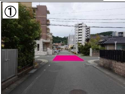
ハンプ設置イメージ