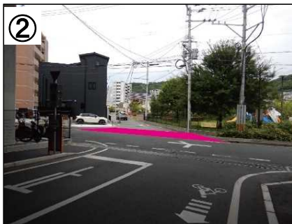
ブロック系舗装設置イメージ