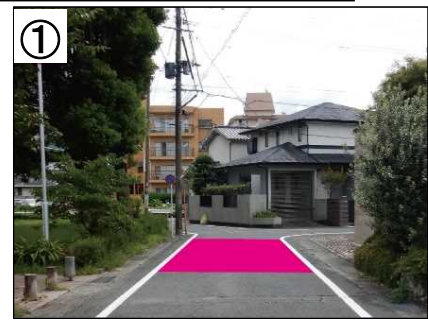
ハンプ設置イメージ