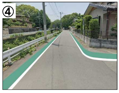
カラー舗装整備イメージ