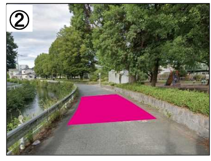
ハンプ設置イメージ