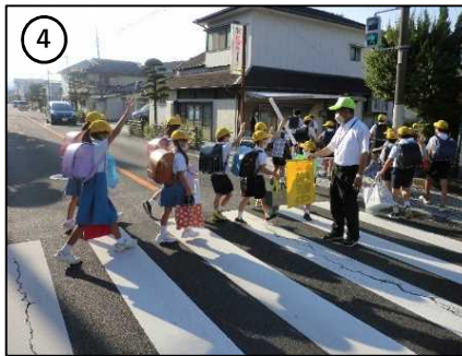
登校時の見守り活動