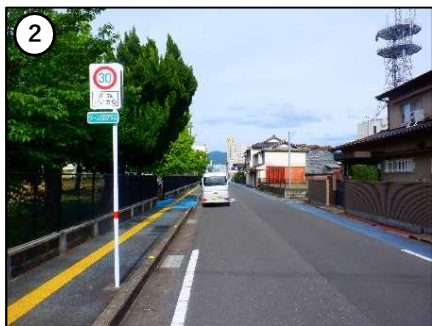
ゾーン30プラス看板