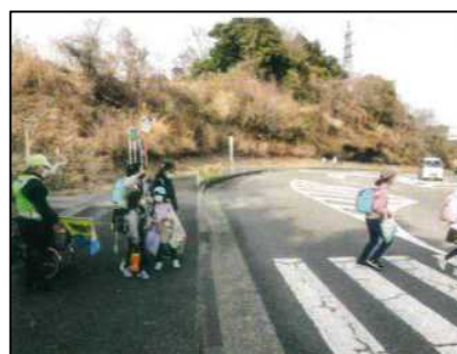
登下校時の見守り活動