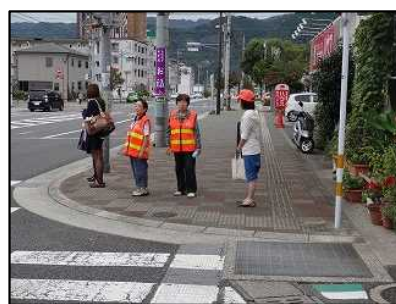
登下校時の見守り活動