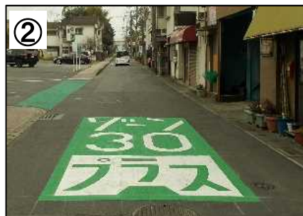
ゾーン30プラス看板・路面表示