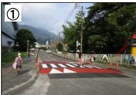
スムーズ横断歩道