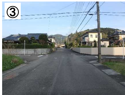
交差点部のカラー舗装 (予定)