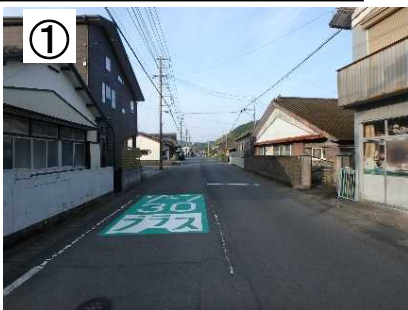
ゾーン30プラス路面表示