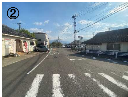
ゾーン30プラス看板・路面表示(予定)