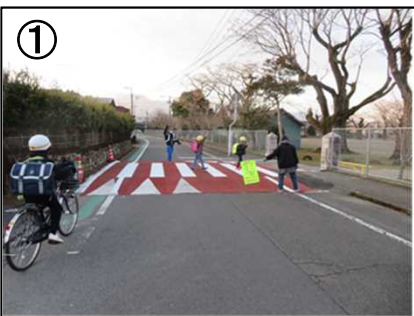
スムーズ横断歩道(実証実験時) 車線分離標(予定)