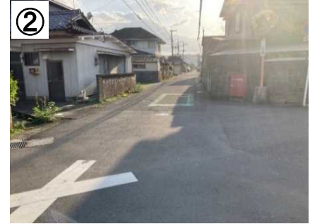
区画線・路面表示 (予定)