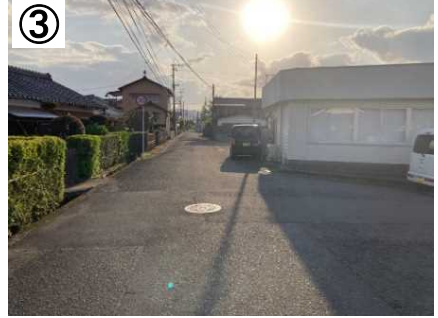
ゾーン30プラス看板・路面表示 (予定)