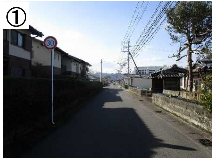
狭さく・区画線 (予定)