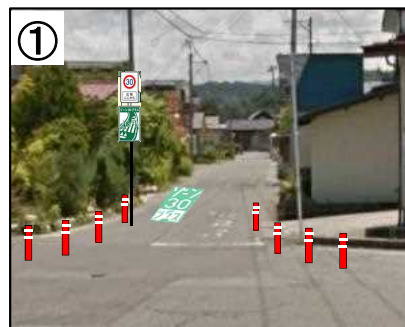
① 狭さく、看板・路面表示 【予定(イメージ)】