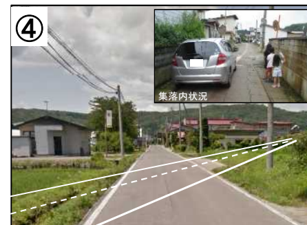
④ 迂回道路設置(集落内抜け道対策) 【予定(イメージ)】