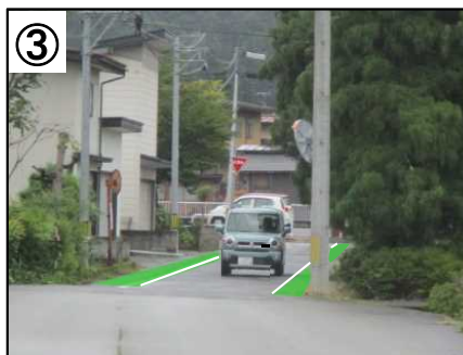
③ カラー舗装【予定(イメージ)】