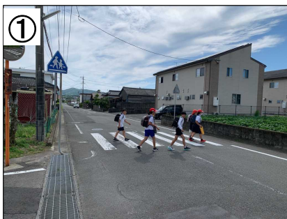
スムーズ横断歩道 (予定)