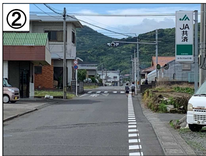
カラー舗装(路肩) (予定)