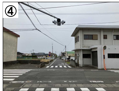
ゾーン30プラス看板・路面表示 (予定)