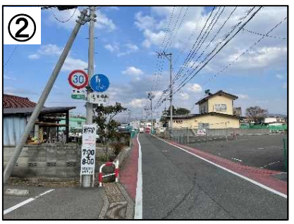
ゾーン30プラス看板・路面表示