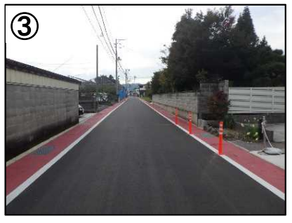
シケイン(クランク型)