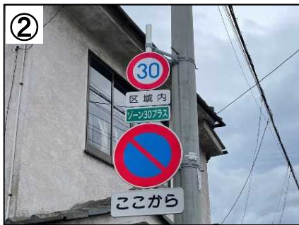
ゾーン30プラス看板