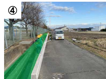
④ 歩道整備(カラー舗装等) 【予定(イメージ)】

※ 今後、実施した対策の効果検証を行い、更なる対策の必要性等について検討していきます。(PDCAサイクルの継続的な取組)