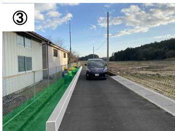
③ 歩道整備(カラー舗装等) 【予定(イメージ)】