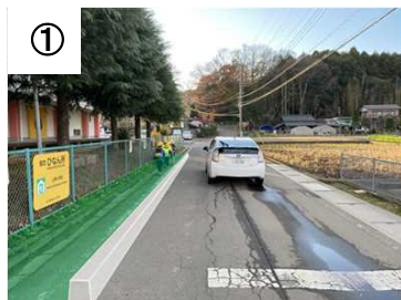
① 歩道整備(カラー舗装等) 【予定(イメージ)】