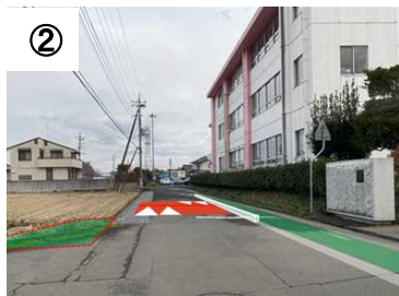
② ハンプ 【予定(イメージ)】