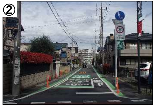
ゾーン30プラス路面表示・看板