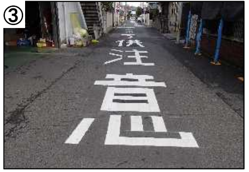
注意喚起の路面表示