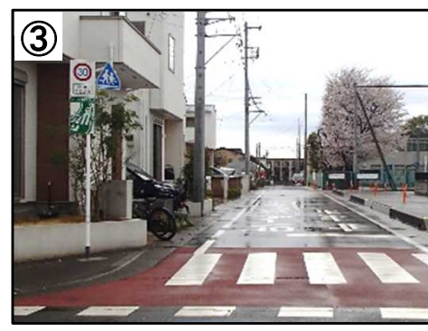
ゾーン30プラス看板・路面表示