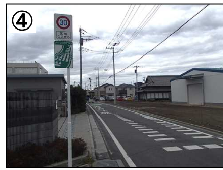
ゾーン30プラス看板・路面表示