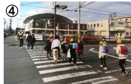
登下校時の見守り活動