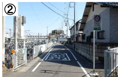
ゾーン30プラス看板・路面表示