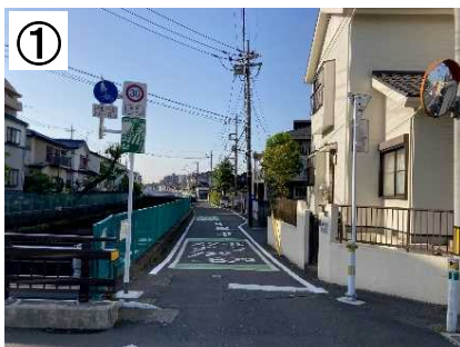
ゾーン30プラス看板・路面標示