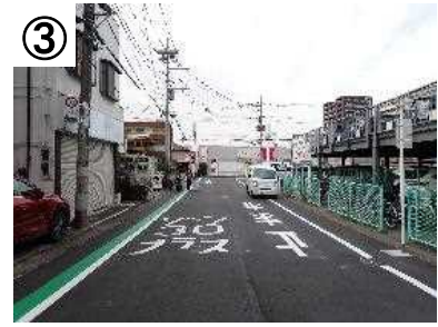
路面表示・カラー舗装