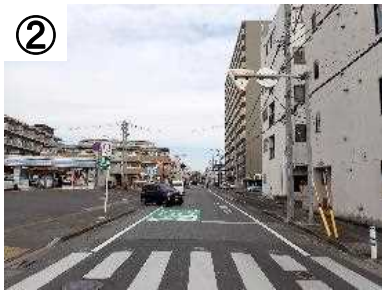
ゾーン30プラス看板・路面表示