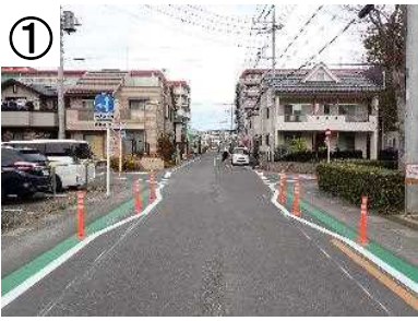
狭さく・カラー舗装