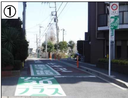
ゾーン30プラス看板・路面表示