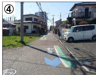
自転車通行位置の明示