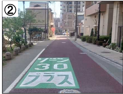
ゾーン30プラス路面表示