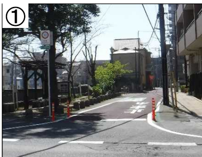
ゾーン30プラス看板・狭さく