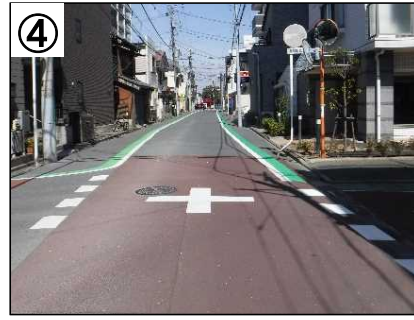
交差点、路肩部カラー舗装