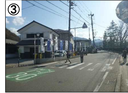
登下校時の見守り活動

※ 今後、実施した対策の効果検証を行い、更なる対策の必要性等について検討していきます。(P D C Aサイクルの継続的な取組)