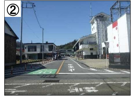
ゾーン30看板・路面表示