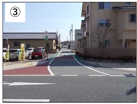
シケイン (クランク)