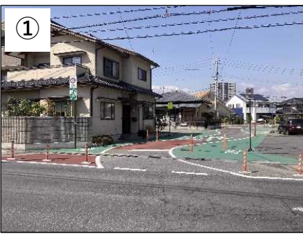
シケイン (スラローム+ポール)