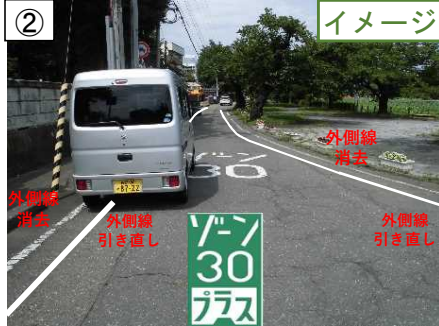
ゾーン30プラス看板・路面表示【予定】